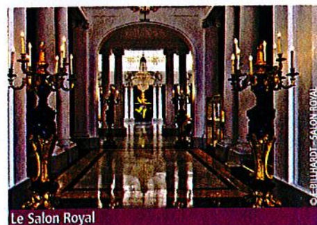
Le Salon Royal