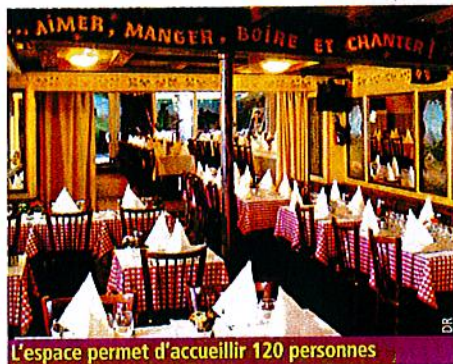
L'espace permet d'accueillir 120 personnes

Cézanne, Toulouse-Lautrec, Renoir, Monet, Zola, Van Gogh... Elle offre plusieurs espaces de réception pour des événements où l'ambiance typiquement parisienne est de mise. Avec ses 50 places, le bistrot reçoit les visiteurs en quête de produits régionaux et de belles références de vins, judicieusement choisis par le maître des lieux. Son décor, chaleureux, en lambris de bois et fixés sous-verre, évoque les régions viticoles de France.