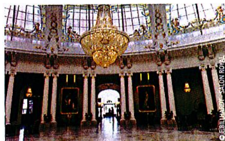
Le hall et sa verrière Eiffel a été intégralement refait